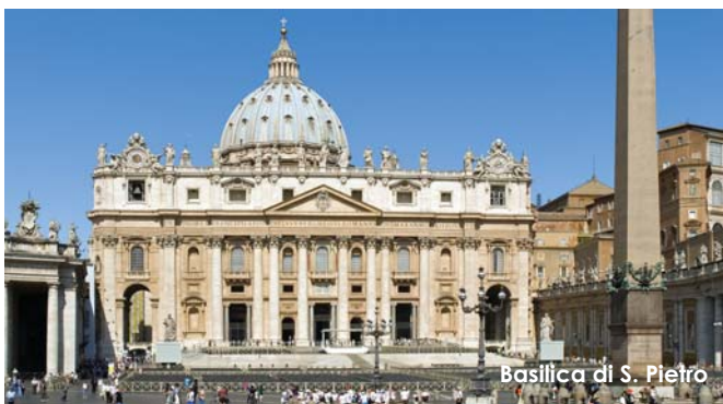
Basilica di S. Pietro