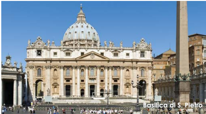
Basilica di S. Pietro