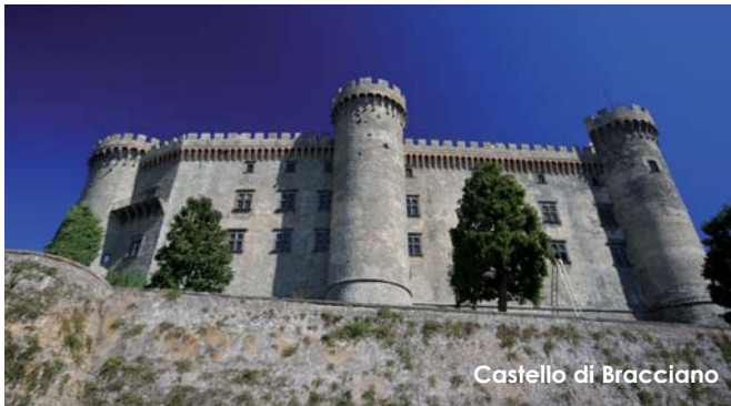
Castello di Bracciano